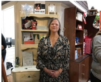
Lancement de nouveaux services du Centre de beauté Sy-Ra-Vi Sainte-Anne-des-Plaines