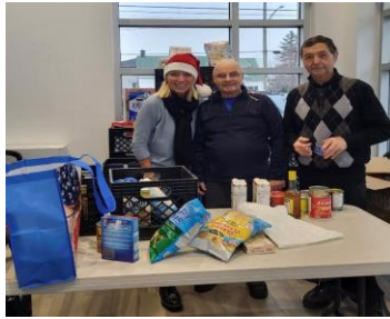
Guignolée des Chevaliers de Colomb de Saint-Janvier Secteur Saint-Janvier