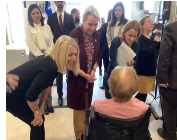
Inauguration de la Maison des Aînés Sainte-Anne-des-Plaines