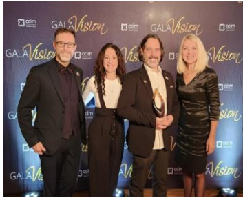
Gala Vision de la Chambre de commerce et d'industrie Les Moulins Terrebonne