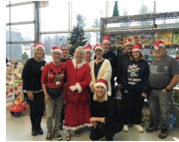
Guignolée du Comité d'aide aux Plinois Secteur La Plaine