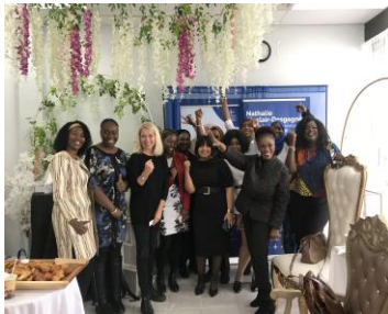
Déjeuner d'affaires du Regroupement de la communautaire noire de Lanaudière Secteur La Plaine